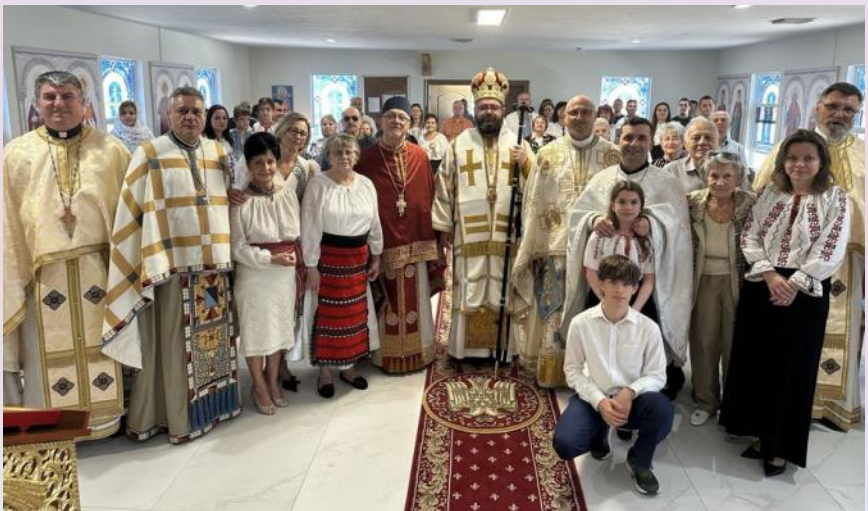
The 15th Anniversary of the Saint Polycarp of Smyrna Parish in Naples, FL (February 23-25, 2024) Cea de-a 15-a aniversare a Parohiei Sfântul Policarp din Smirna, Naples, FL (23-25 Februarie, 2024)