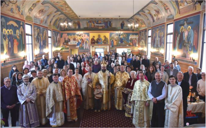
The 15th Anniversary of the Holy Forty Martyrs of Sebaste Parish in Aurora, ON (March 8-9, 2024) Cea de-a 15-a aniversare a Parohiei Sfinții Patruzeci de Mucenici din Aurora, ON (8-9 Martie, 2024)