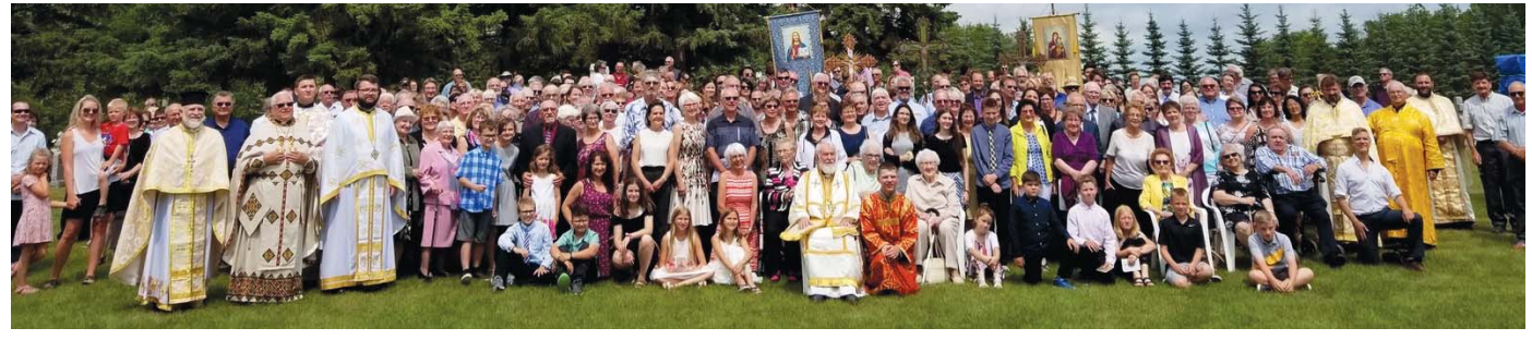
Aniversarea de 100 de ani a Parohiei Sf Ioan Botezătorul, Shell Valley, Manitoba, Canada - 7 iulie 2019 - peste 500 de credincioși veniți din toată Canada au participat la acest eveniment.