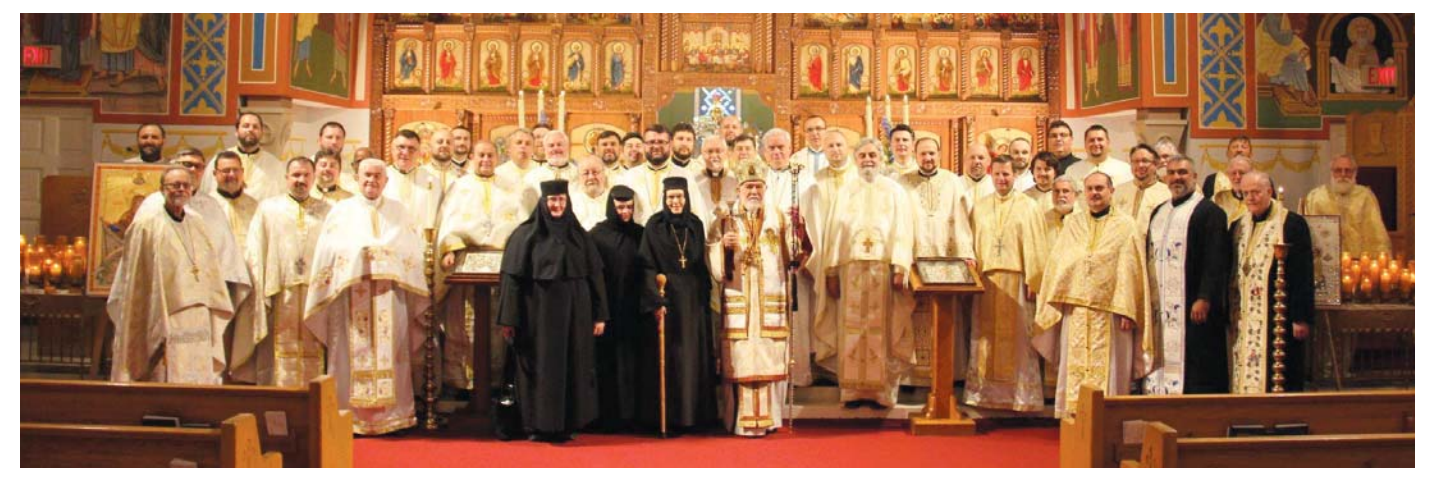
Archbishop Nathaniel is surrounded by clergy and monastics following the Hierarchal Divine Liturgy on Sunday.