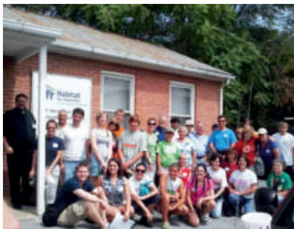
Washington, DC, Habitat for Humanity Volunteers

SYOSSET, NY [OCA]The OCA Department of Christian Service and Humanitarian Aid [CSHA] recently posted a new article, "Where is Your Jerusalem," in its Parish Ministry Resources , formerly known since the 1980s as the Resource Handbook for Ministries .