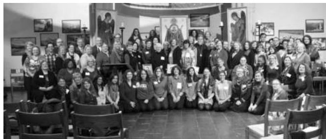
Participants at the St. Phoebe Center Conference on “Women and Diaconal Ministry in the Orthodox Church: Past, Present, and Future”

Enthusiasm and prayer marked the first U.S. conference on women deacons in the Orthodox Church sponsored in New York City, on December 6, by St. Phoebe Center for the History of the Diaconess. Although the issue of the reinstatement and rejuvenation of the ordained deaconess has been discussed in Orthodox circles for over 150 years, this is the first time that a conference has been devoted to the exploration of this issue particularly and addressed how an ordained female diaconate could help the Church today.